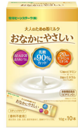
スティックタイプ