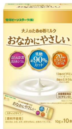
スティックタイプ