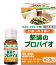
整腸のプロバイオ