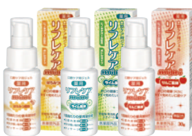
薬用 口腔ケア用ジェル リフレケア