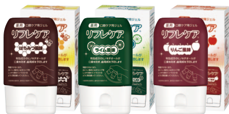
薬用 口腔ケア用ジェル リフレケア