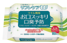
口腔清拭シート リフレケアW